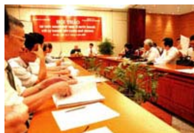
Các đại biểu dự hội thảo.

Tới dự hội thảo "Trí thức người Việt Nam ở nước ngoài với sự nghiệp xây dựng quê hương", mỗi đại biểu có một tâm trạng, một hoàn cảnh khác nhau. Nhưng tất cả đều có chung một mục đích là hướng về đất nước với tấm lòng chân thành.