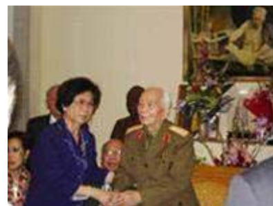
Kiều bào ở Thái Lan chúc tết Đại tướng