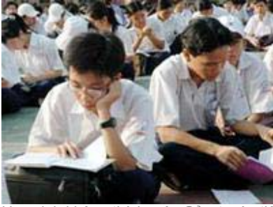
Học sinh không thích môn Sử - trước tiên hãy xem lại cách giáo dục trong nhà trường

Kiến thức lịch sử của giới trẻ vốn đã có nhiều khiếm khuyết và khoảng trống, nhưng qua kỳ thi tuyển sinh ĐH, CĐ 2005 vừa qua, với khoảng 60% số bài thi môn sử dưới 1 điểm thì vấn đề đã được nhìn nhận đầy đủ hơn, không chỉ là những con số mà còn được nhân lên bởi những câu chuyện, những câu trả lời “cười ra nước mắt”.