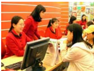
Tìm đến các trung tâm ngoại ngữ để nâng cao trình độ. (Ảnh: A.T)

Các giáo sư quốc tế đều có ấn tượng tốt về tinh thần hiếu học, cử chỉ lễ phép với các thầy trong giao tế, về lòng hiếu khách của thanh niên Việt Nam. Họ cũng bảo: nói chung sinh viên Việt Nam có căn bản toán và khả năng tiếp thu tri thức khoa học rất tốt, nhất là thông qua máy tính.