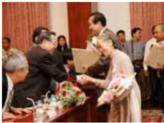
Thủ tướng Phan Văn Khải chúc mừng bà con Việt kiều được tặng bằng khen.

Chiều tối 30/1 (tức 21 tháng chạp âm lịch), trong không khí tươi vui của mùa xuân đang về, đông đảo bà con Việt kiều về nước ăn Tết đã tham dự buổi tất niên do UBND TP.HCM tổ chức tại Dinh Thống Nhất. Thủ tướng Phan Văn Khải cũng đến chung vui. Đến dự họp mặt tất niên có hơn 600 Việt kiều từ 20 nước, và khoảng 100 Việt kiều đã hồi hương. Buổi họp mặt bắt đầu lúc 17h30, nhưng rất đông Việt kiều đã đến sớm để trò chuyện cuối năm, đi vòng quanh thăm Dinh Thống Nhất, trong đó có ông Nguyễn Cao Kỳ.