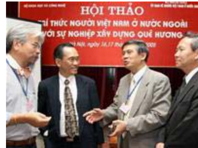
Các giáo sư, tiến sĩ đang trao đổi kinh nghiệm về các vấn đề quan tâm đến sự nghiệp xây dựng quê hương tại hội thảo