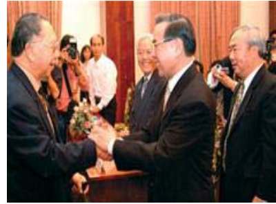
Thủ tướng Phan Văn Khải bắt tay giáo sư Trần Văn Khê trong cuộc họp mặt bà con Việt kiều tại dinh Thống Nhất

TTCN - 400.000 là con số kỷ lục từ trước đến nay về lượng Việt kiều về nước trong năm 2004. Bởi như lời Thủ tướng Phan Văn Khải trước hơn 600 Việt kiều tại buổi họp mặt mừng xuân Ất Dậu tại dinh Thống Nhất tối 30-1: “Người VN ở nước ngoài dù đi đâu, ở đâu, dù đi ra nước ngoài vì bất cứ lý do gì, họ cũng là máu của máu VN, thịt của thịt VN”. Đã là máu, là thịt thì chẳng có gì tách họ khỏi quê cha, đất tổ.