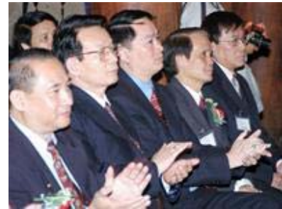
Các kiều bào tại Lễ trao giải

Phát biểu với các đại biểu, ông Lê Truyền, phó Chủ tịch Ủy ban Trung ương mặt trận tổ quốc bày tỏ mong muốn rằng “Vinh danh nước Việt” sẽ không chỉ đơn thuần là một danh hiệu mà khái niệm ấy sẽ trở thành ý thức, nhiệm vụ và nguyện ước trong mỗi người con đất Việt sống xa Tổ quốc.