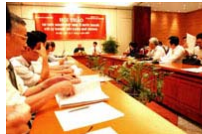
Các đại biểu dự hội thảo.

Tới dự hội thảo "Trí thức người Việt Nam ở nước ngoài với sự nghiệp xây dựng quê hương", mỗi đại biểu có một tâm trạng, một hoàn cảnh khác nhau. Nhưng tất cả đều có chung một mục đích là hướng về đất nước với tấm lòng chân thành.