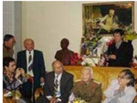
Quây quần bên Đại tướng

Năm nay đã bước vào tuổi 95, tuy tuổi cao, sức khỏe có phần giảm sút, nhưng Đại tướng vẫn còn rất minh mẫn.