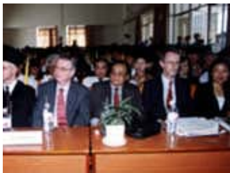
Lễ tốt nghiệp khóa 3 Cao học Quản trị Việt - Bỉ

Hôm nay 31.5, tại ĐH Bách khoa Hà Nội và ngày 4.6 tại ĐH Bách khoa TP Hồ Chí Minh sẽ diễn ra lễ phát bằng thạc sĩ trong khuôn khổ hai chương trình đào tạo cao học do EU tài trợ từ năm 2001: chương trình European Master Modedlisation of Continuum (EU- EMMC) và European Master in Modelisation and Design in Engineering Sciences (EU-EMMD).